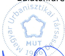
ACZÉL GÁBOR a Magyar Urbanisztikai Társaság elnöke